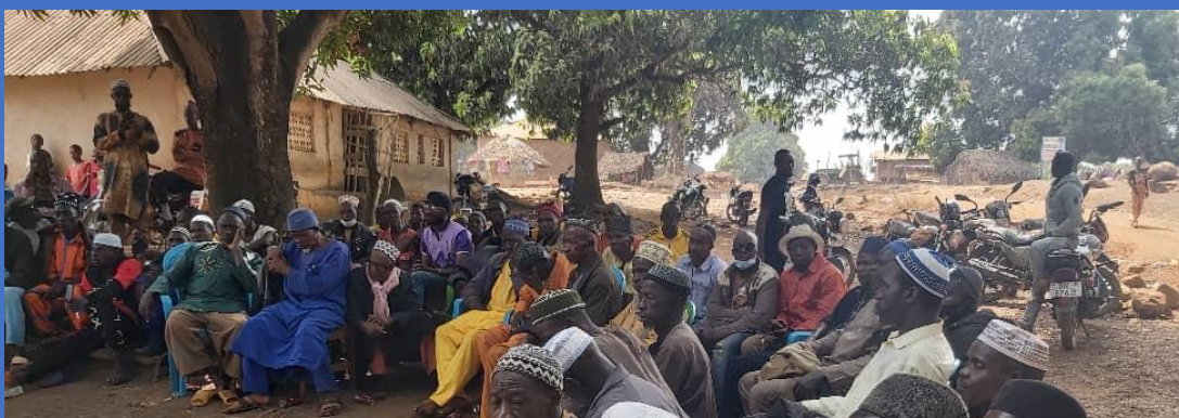
Séance de sensibilisation dans le secteur de Bombia, district de Sekou-soryah, sous-préfecture de Madina-oula (28/02/2024).

Au total quatre (4) séances de sensibilisations ont été organisées pour un total de 117 personnes touchées dont 44 femmes.