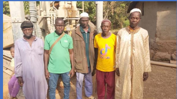
Construction des forages dans les secteurs de Bombia et Guegueyah, district de Sekou-soryah, sous-préfecture de Madina-oula (28/02/2024).

A date, après consultation des membres du comité de suivi, nous dressons les constats suivants :